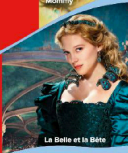
La Belle et la Bête